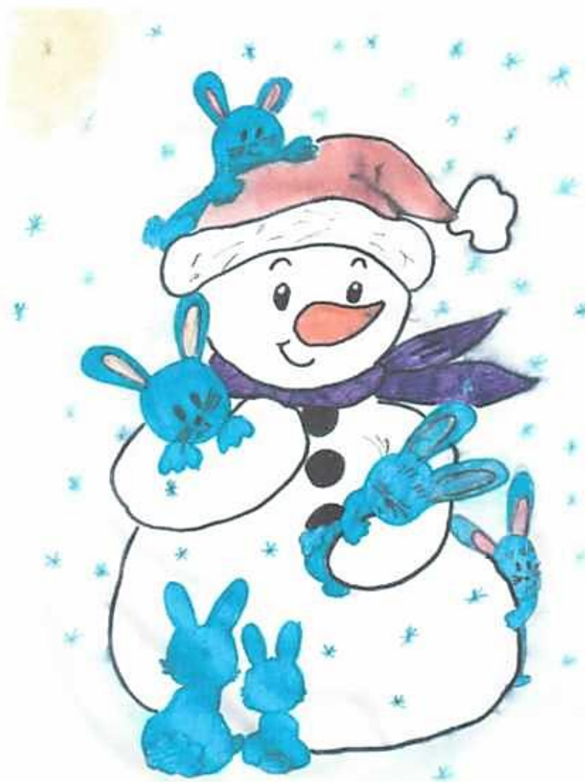
Рис. Гаврилова В., 6 А.