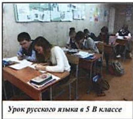
Урок русского языка в 5 В классе

- Отличий много, но самое главное отличие в том, что ученики сами выстраивают ту цель, которую они стараются достигнуть к концу урока.