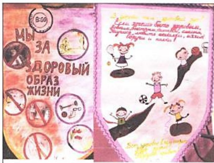
На фото представлены работы, выполненные учащимися среднего звена