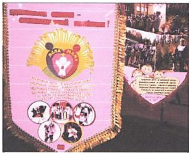
На фото представлены работы, выполненные учащимися начальной школы