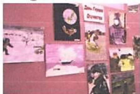
На фото работы учащихся, посвящённые Героям Отечества