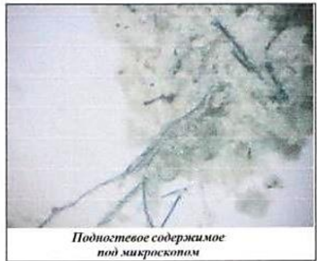
Подногтевое содержимое под микроскопом

Вот несколько советов тем, кто уже принял решение избавиться от