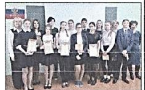
Участники школьного тура Всероссийского конкурса "Живая классика"

ствием слежу за содержанием читаемых произведений. Мне кажется одно лучше