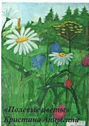
«Полевые цветы» Кристина Анискина