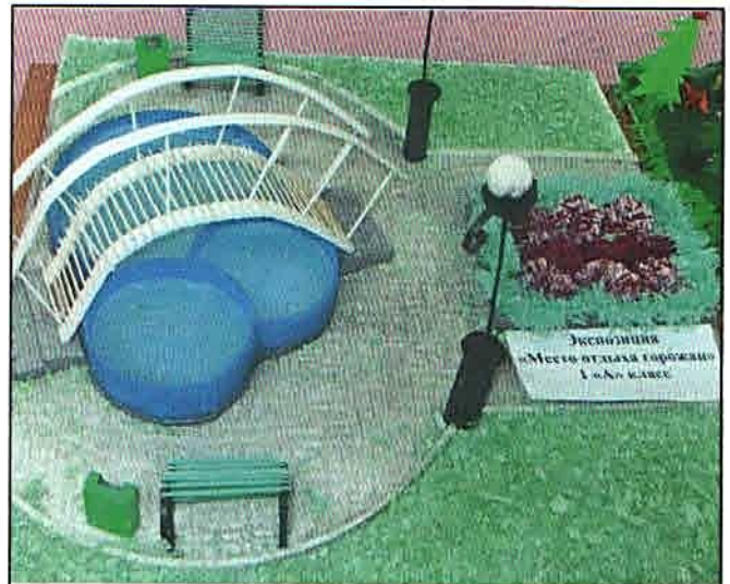
Макет 1 А класса

В конкурсе плакатов среди 5-6 классов первое место жюри присудило 5 Б классу, второе - 6 Б классу и третье - 6 В.