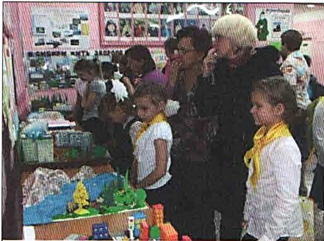
Всем было интересно

20 ноября в нашей школе проходил конкурс плакатов, макетов и рисунков, посвященный 80-летию края. Все классы приняли активное участие в этом коллективном творческом деле. Работы уча-