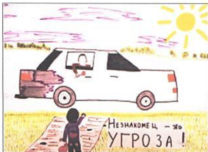
Рисунок Татьяны Брюхановой, 7 Г класс