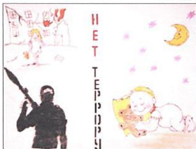
Рисунок Елизаветы Шнайдер, 7 Г класс