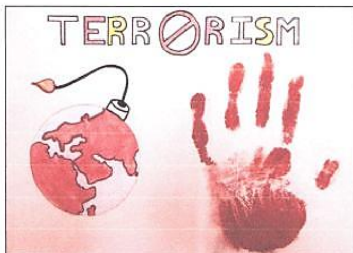
Рисунок Дарьи Постниковой, 7 Г класс