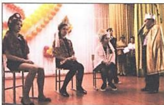
На фото фрагмент сказки

Интересным событием в ноябре оказалось мероприятие под названием "В гостях у сказки"...Учащиеся 5-6 классов соревновались между собой не только в знании названий сказок, героев, авторов, но и в умении разыграть сказку на сцене. Здесь, несомненно, героями дня стали учащиеся 5 а класса. Они хоть и нарушили регламент, но поставили "Тере-