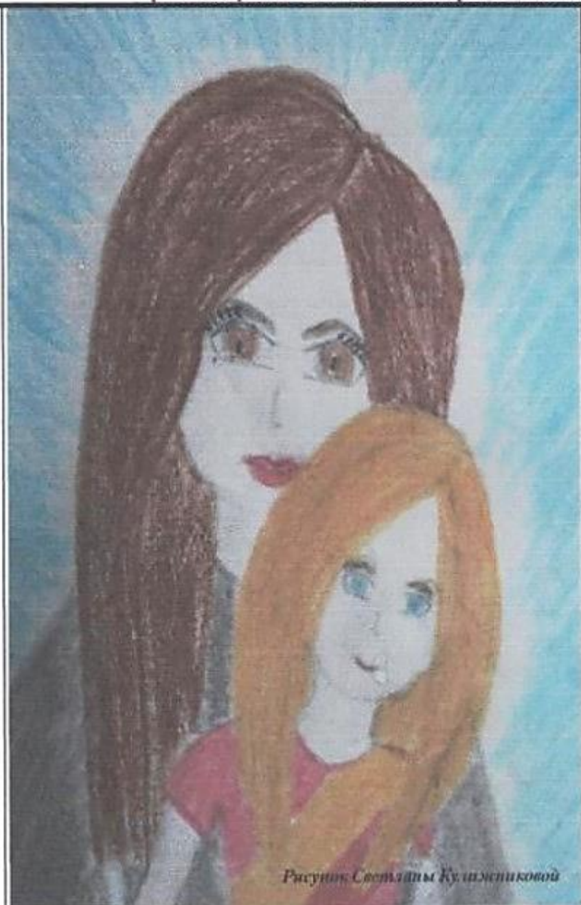
Рисунок Светланы Кузнециковой

МКОУ «Кодинская средняя общеобразовательная школа № 4» при поддержке МКУ ДО «Центр дополнительного образования детей»