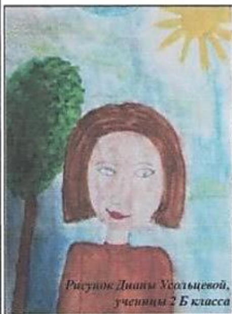
Рисунок Дины Хасъцевой, ученицы 2 Б класса