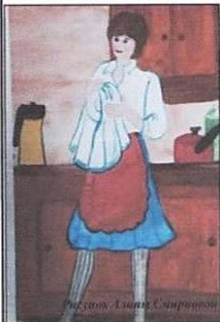
Рисунок Алены Смирновой