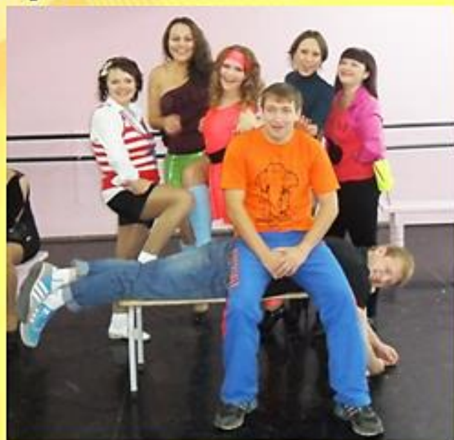
«Ученики», отличившиеся безобразным поведением

Когда закончились уроки, на общем собрании, где присутствовали и «ученики», и «учителя» с «администрацией» школы, были подведены итоги прошедшего учебного дня, где лжеучителя признались, что профессия учителя – одна из труднейших, которая требует очень много сил, как физических, так и душевных. Все поблагодарили друг друга за приобретение значительного опыта и позитивных эмоций. А самые пакостные «ученики» были награждены грамотами «За безобразное поведение на уроках». После чего учителя были приглашены на концерт, посвящённый празднику. Вот так прошёл у нас этот день, полный веселья, радости и поистине праздничного настроения!