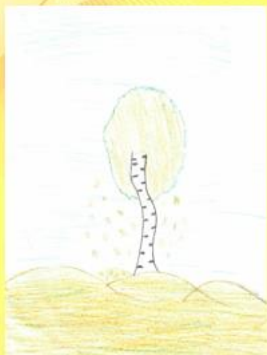
Рис. Елизавета Ковальчук, 6 В