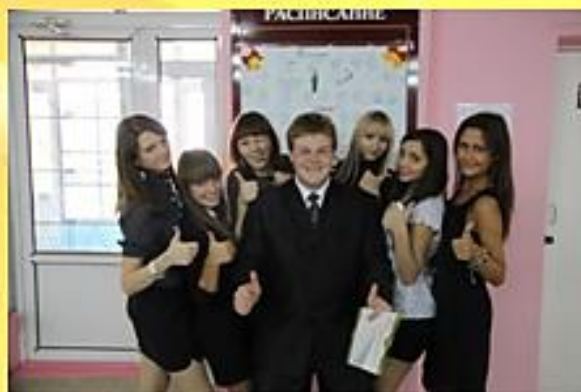
Названные «учителя» и «администрация» школы

5 октября – замечательный праздник наших учителей – День учителя. И наша школа, конечно же, не осталась в стороне! В этот день у нас проводился День дублёра, или День самоуправления. Все учителя и администрация школы были в роли учащихся, а ученики, наоборот – в роли учителей и администрации. Учителя были поделены на два класса – 12 «а» и 12 «б» и сидели на уроках, среди которых были такие, как ритмика, музыка, ИЗО. Ох, и трудно же было названным «учителям»!