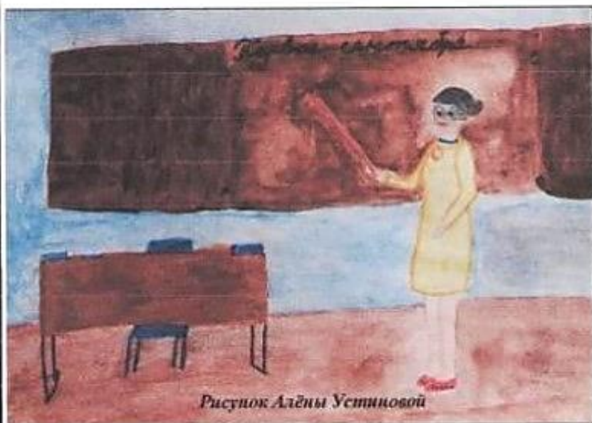
Рисунок Алёны Устиновой

но пускала слова на ветер (тратила усилия попусту). Ученики сидели сложа руки и гоняли балду (бездельничали). Кое-кто хлопал ушами (слушал, не понимая). Они так навязли в зубах (крайне надоели) учительнице, что она стала грозить пальцем (сердиться), но все псу под хвост (бесполезно). Доведенная до белого каленя, устав,,