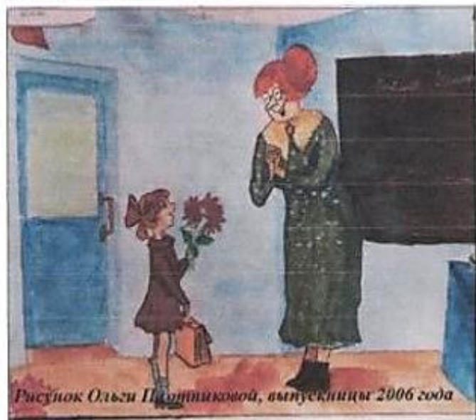
Рисунок Ольги Плотниковой, выпускницы 2006 года

Мы поздравляем и Вас, и всех учителей нашей замечательной школы с Днём учителя!!! Очень хотим, чтобы работа, трудная, ответственная, приносила Вам много радости!!! Пусть ученики всегда любят Вас!!!