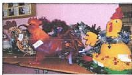
Вот такая выставка