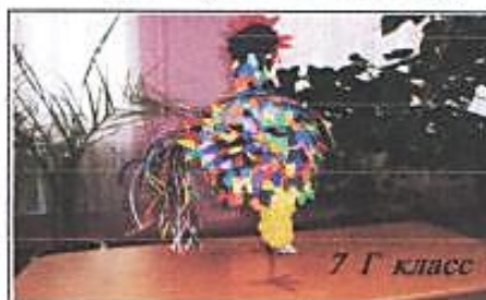
7 Г класс

Все классы представили красочные открытки, в которых поздравили ребят, учителей и всех работников школы с Новым годом! Особенно мне понравился "символ года", нарисованный учащимися 9В класса. Он похож на человека. Наверное, ребята хотели сказать, что не надо ждать милости откуда-то извне, а надо просто строить счастье своими руками, как в песне поётся: "Ты знаешь - всё в твоих руках, всё в твоих руках, всё в твоих ру-