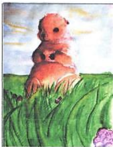
Рисунок Даяны Галеевой, 7Акласс

ки умереть от голода. В некоторые годы смертность ежей во время спячки доходит до 86 % молодняка и 30-40 % взрослых.