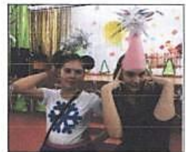
Учащиеся 6 В класса

класс на сцене представил новогодний номер. Это были и сказочные спектакли (5А, 5Б, 6В, 5Г), и новогодние песни (6 А), и танцы (6Б). Но самое главное, что ребята с удовольствием принимали участие в развлекатель