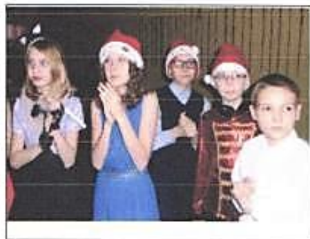
Учащиеся 5 А и 5 Б классов