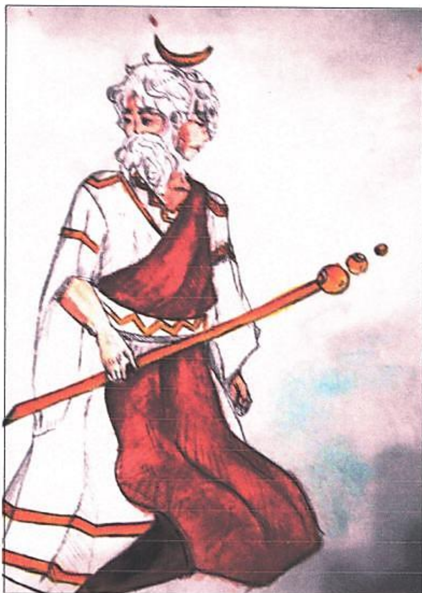
Рисунок Даяны Галеевой, 7А класс

Некоммерческое издание клубного объединения МКУ ДО ЦДОД в МКОУ «Кодинская средняя общеобразовательная школа № 4»